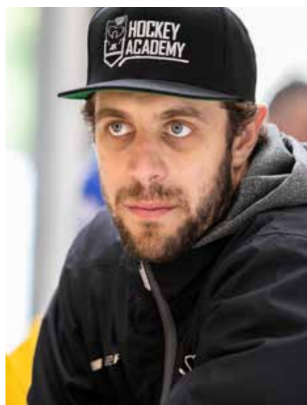
ANŽE KOPITAR

Anže Kopitar, dvakratni zmagovalec Stanleyjevega pokala z ekipo Los Angeles Kings