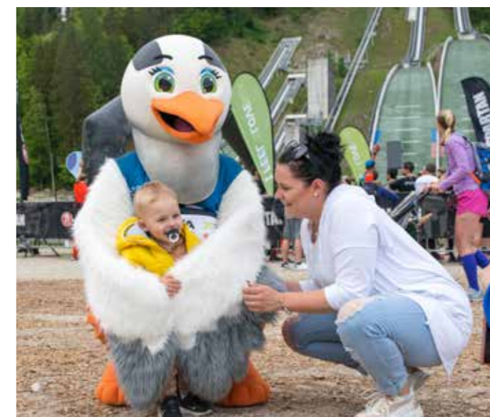
VITA IN SPARTAN RACE