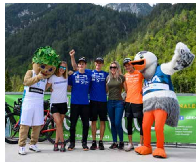
VITA IN AKCIJA GREMO V HRIBE