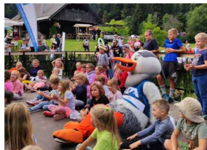
VITA IN OVČARSKI BAL NA ZATRNIKU