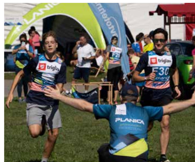
NAŠA EKIPA NA TRIGLAV TEKU