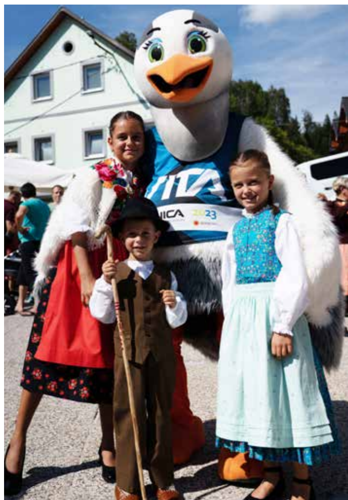
VITA NA VAŠKEM DNEVU V RATEČAH