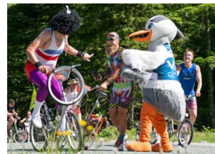
VITA IN GONI PONY