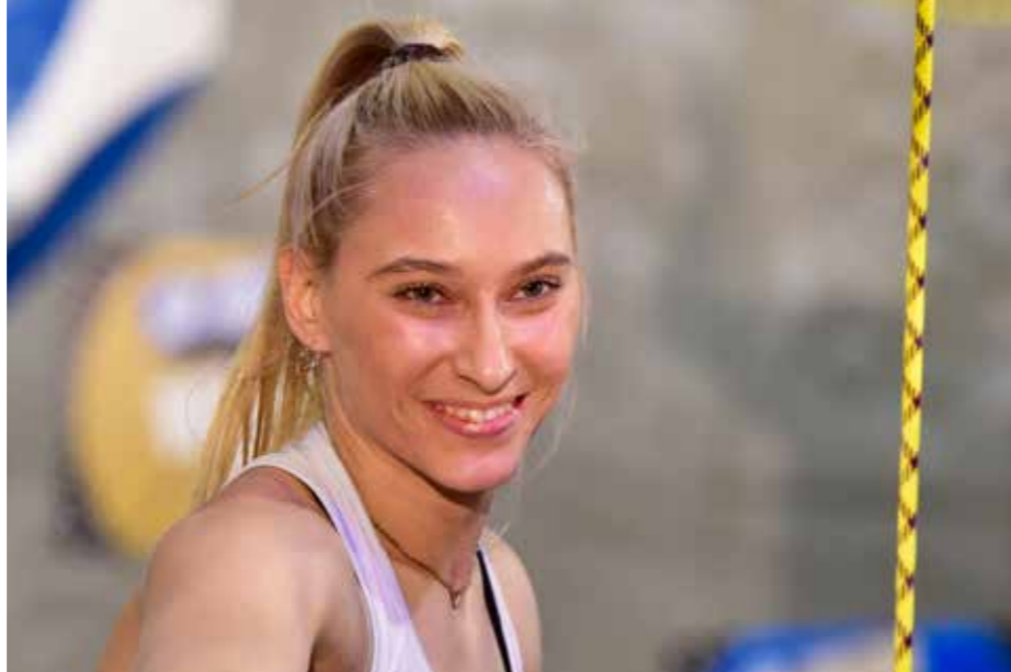
JANJA GARNBRET