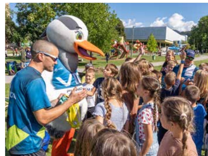
VITA NA PIKINEM FESTIVALU V VELENJU