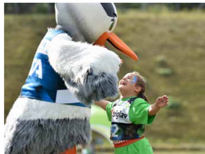
VITA IN JUNAKI 3. NADSTROPJA