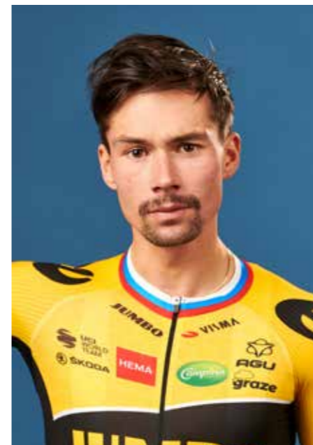
PRIMOŽ ROGLIČ

»Tekmovati na svetovnem prvenstvu je poseben privilegij in nagrada za vsakega športnika, velikokrat je to tekmovalstvo, na katerega misliš daljše obdobje in se nanj pripravljaš. Če pomislim, slovenski športniki res nimamo veliko priložnosti, da bi se za tako pomembna odličja borili na domačih tleh, zato moram priznati, da kar malce zavidam našim nordijskim smučarjem. Vem, da to sicer prinaša še dodaten pritisk, kar ni enostavno, a vsem želim, da to obrnejo v svoj prid in da jim to vlije še dodatnih moči za to, da jim uspe najboljši nastop v svojih karierah. Že zdaj stiskam pesti za vse in se veselim, da bo Planica v vsej lepoti, ki jo premore, končno gostila svetovno prvenstvo!«