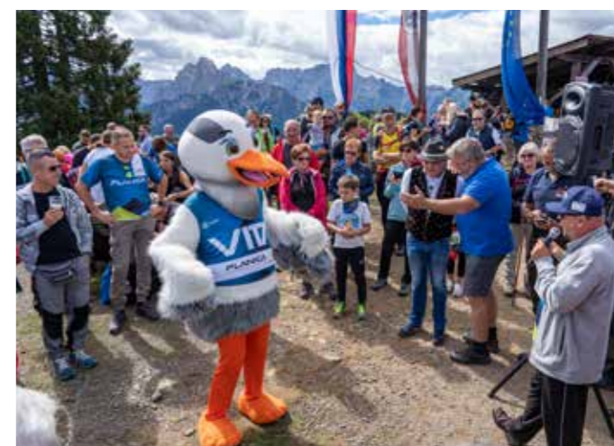
VITA NA SREČANJU NA TROMEJI