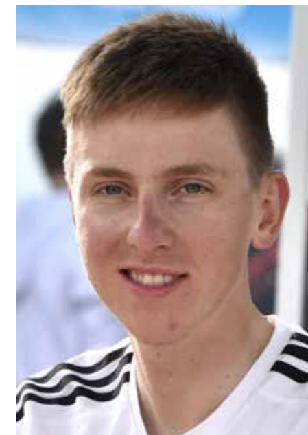
TADEJ POGAČAR

»Prepričan sem, da bo svetovno prvenstvo v Planici znova pravi športni praznik. Sam zelo uživam, ko tekmujem na slovenskih cestah, imeti tekmovalstvo takšnega nivoja, kot je